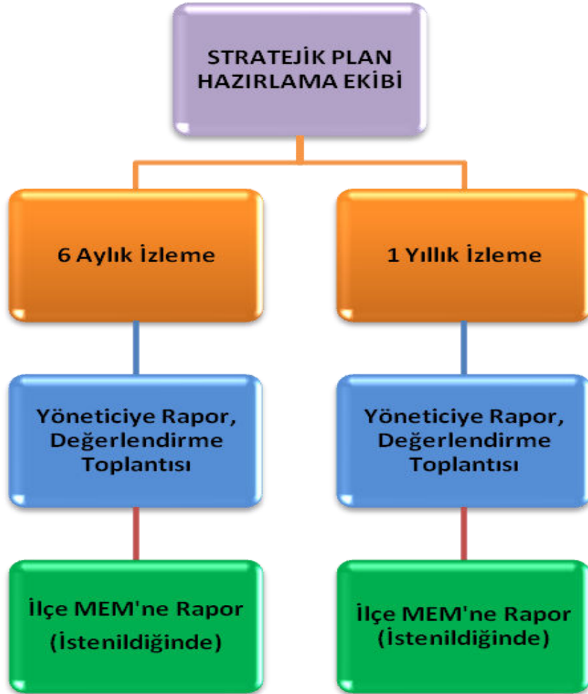
Şekil 2 İzleme ve Değerlendirme Süreci

Müdürlüğümüzün 2024-2028 Stratejik Planı İzleme ve Değerlendirme sürecini ifade eden İzleme ve Değerlendirme Modeli hazırlanmıştır. Müdürlüğümüzün Stratejik Plan İzleme- Değerlendirme çalışmaları eğitim-öğretim yılı çalışma takvimi de dikkate alınarak 6 aylık ve 1 yıllık sürelerde gerçekleştirilecektir. 6 aylık sürelerde Üst Yöneticiye rapor hazırlanacak ve değerlendirme toplantısı düzenlenecektir. İzleme-değerlendirme raporu, istenildiğinde Stratejik Geliştirme Başkanlığına gönderilecektir. Ayrıca ilimizin Mülki İdari Amirine sunulacaktır. 1 yıllık izleme-değerlendirme çalışmaları, Stratejik Planımızda yer alan hedeflerin yıllık düzeyde ifade edildiği Performans Programı ve yılsonunda gerçekleşme düzeylerinin belirlendiği Faaliyet Raporu hazırlanarak yapılacaktır. Performans Programı ve Faaliyet Raporu Üst Yöneticinin değerlendirmesinin akabinde Strateji Geliştirme Başkanlığına ve Mülki İdari Amire sunulacaktır. Yıllık izlemelerle ilgili değerlendirme toplantıları düzenlenecektir.